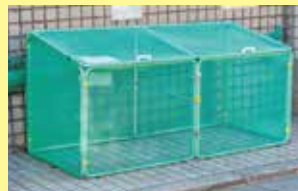
फोल्ड गर्न रूप गोमी स्टेशन

स्टेनलेस स्टील, एल्युमिनियम, प्लास्टिक बाट बनाएको गोमी स्टेशन, फ्यूजिकल रूपमा कागलाई गोमीको टाढामा पार्नेछ। घर, अपार्टमेन्ट, ब्लक हरू जस्तो ठाउँ अनुसार, आवश्यकता मिलाएर निश्चित रूप, फोल्ड गर्न रूप हरू छान्नुहोस्।